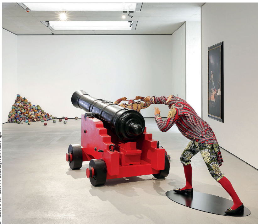
Una veduta della mostra «Yinka Shonibare CBE. End of Empire» in corso al Museum der Moderne di Salisburgo