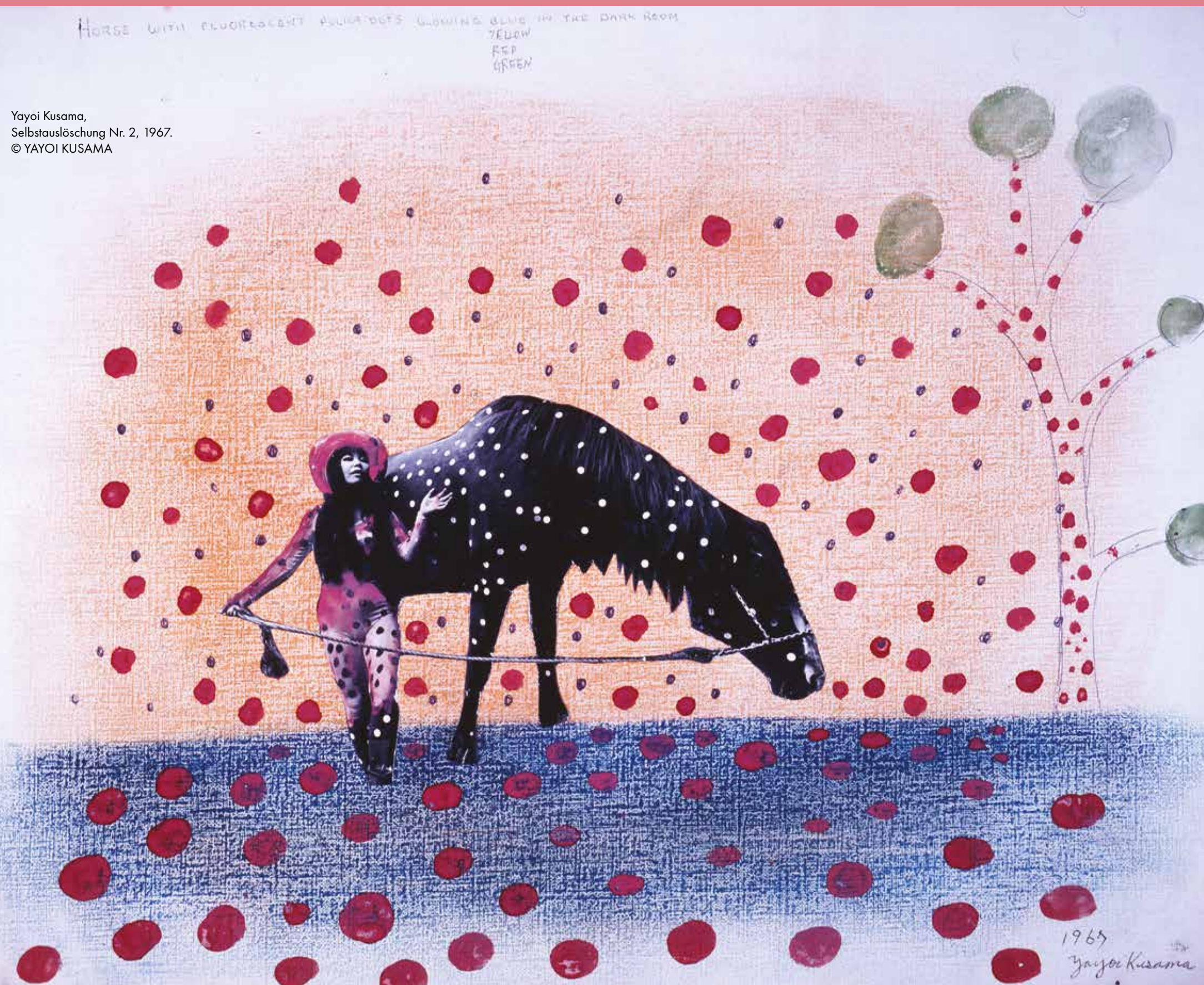
Yayoi Kusama, Selbstauslöschung Nr. 2, 1967. © YAYOI KUSAMA